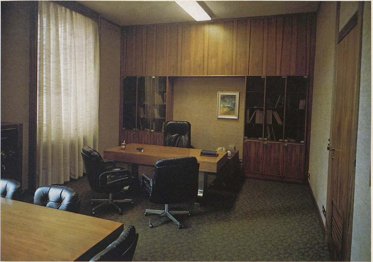
Ufficio del Direttore

ad esempio, la FISPAO assume l'amministrazione di interi patrimoni con risultati che soltanto una « linea » di collaboratori e di esperti qualificati nei vari settori può garantire.