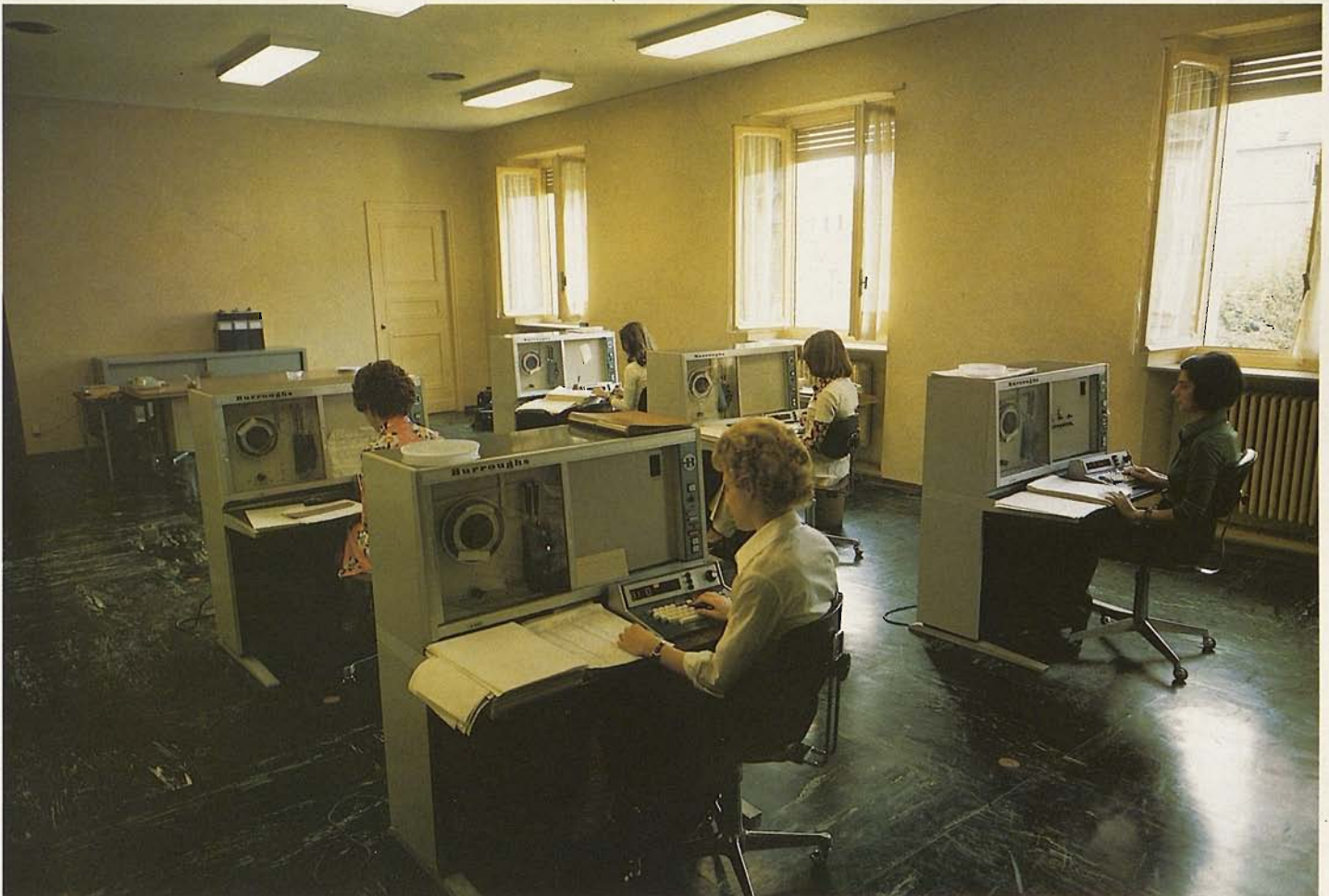
\nabla Sala delle macchine perforatrici