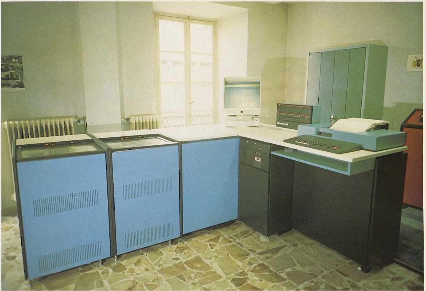
Sala dell'elaboratore elettronico \triangle