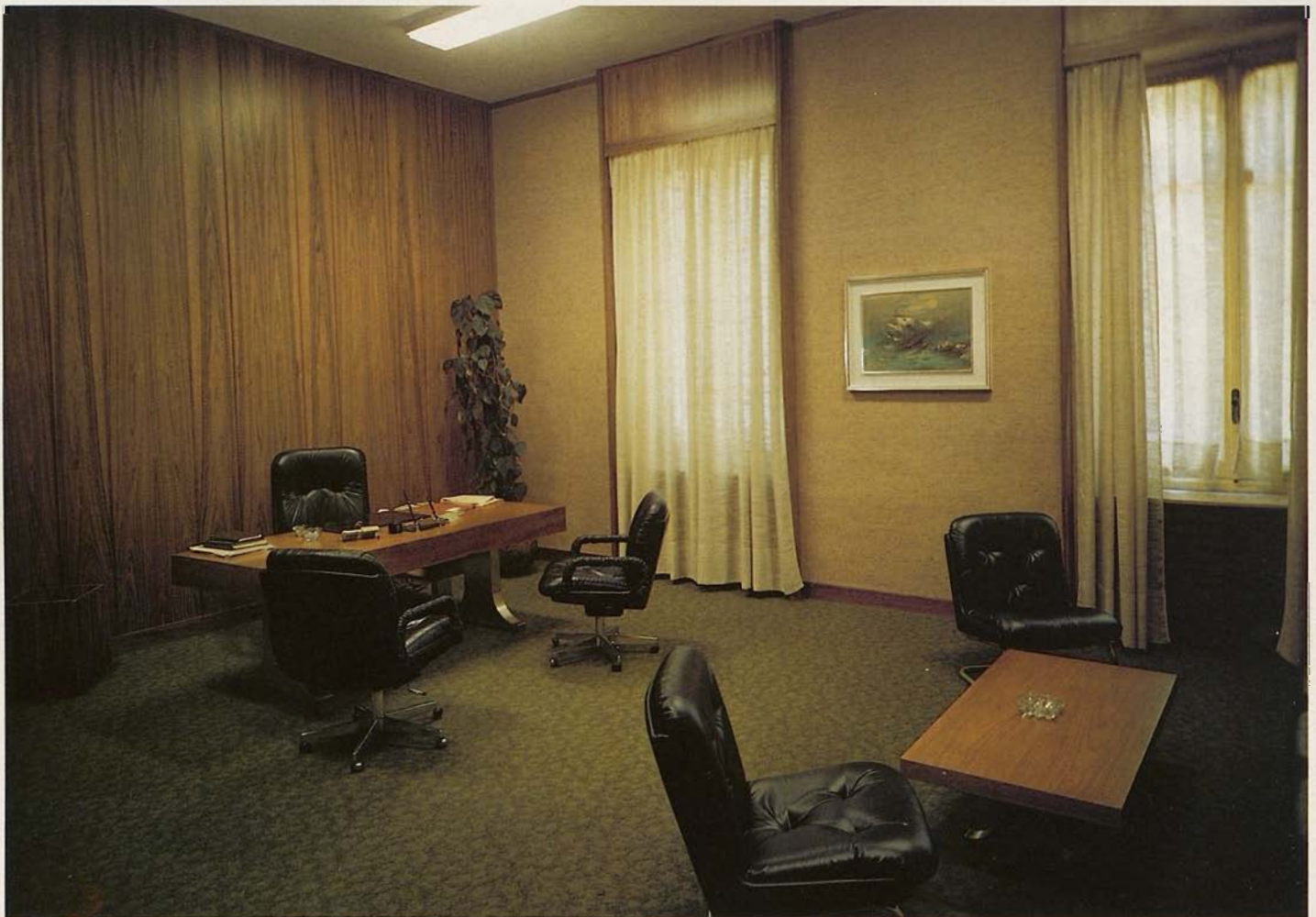
Ufficio del Presidente ed Amministratore Delegato

Per conto di persone che non sono in grado, ovvero che non desiderano provvedervi direttamente,