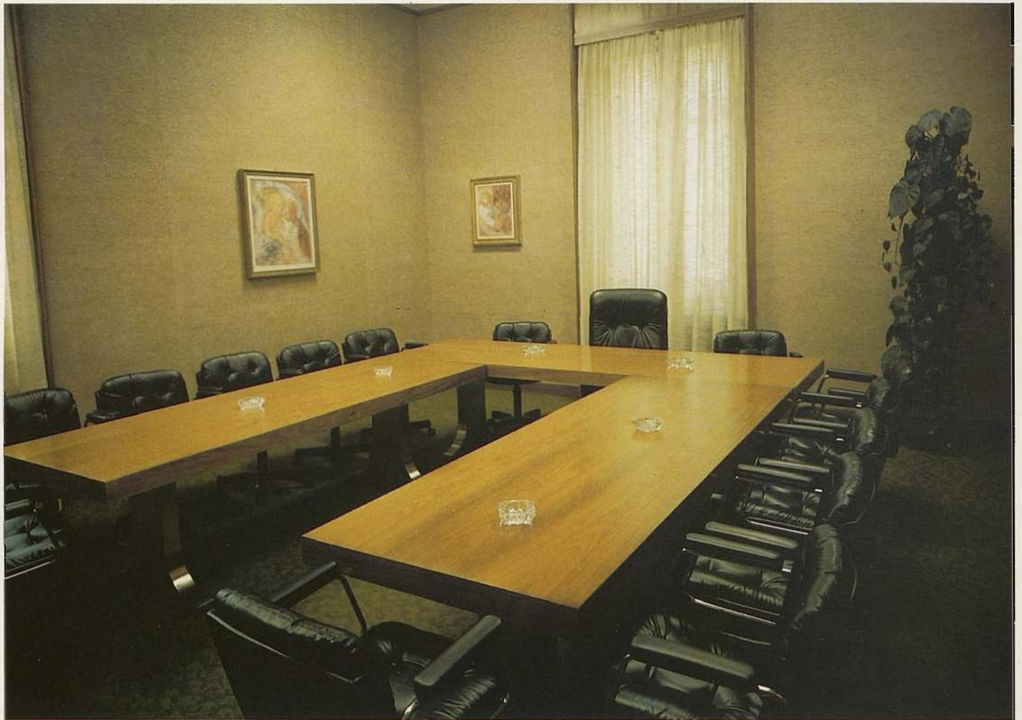
Sala di riunione a disposizione dei clienti

incombenze relative alla certificazione dei bilanci societari e di controllo sulle operazioni di trasferimento dei titoli azionari, compiti questi che la nuova legge dovrebbe rendere obbligatori per le società quotate in borsa. In previsione di ciò la FISPAO dovrà rivedere la sua attuale struttura per meglio fronteggiare la mole di lavoro che scaturirà anche in questo settore, nel quale pure operano da tempo filiazioni di importanti società di revisione straniere che si avvalgo-