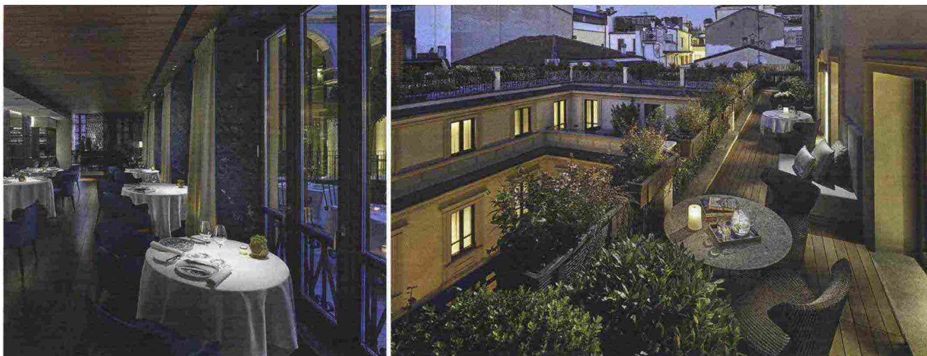
Sopra, la sala ristorante e la terrazza di una suite dell'hotel Mandarin; in basso, un momento del Milano Film Festival. Nella pagina precedente, i cori in Piazza Duomo di MiTo Settembre Musica

ottobre è tempo di Milano Film Festival che torna negli spazi del Base Milano di Via Tortona, del Mudec e del Cinema Ducale , dopo il successo della sperimentazione dello scorso anno. Undici giorni di proiezioni, cuore del programma come ogni anno è il Concorso Lungometraggi , aperto solo a opere prime e seconde di registi provenienti da ogni parte del mondo, tutte in anteprima italiana, e il tradizionale Concorso Cortometraggi , riservato a registi under 40. In concorso quest'anno e presentato in anteprima italiana il film evento England is Mine , è il primo biopic dedicato alla vita di Morrisey , frontman e fondatore dei The Smiths , diretto da Mark Gill , già candidato agli Oscar nel 2014 per il miglior cortometraggio. Spazio anche alle rassegne speciali, i workshop e gli incontri dedicati a tutti gli appassionati di cinema indipendente ( www.milanofilmfestival.it ). Settembre è anche il mese in cui tornano le grandi mostre. Dal 6 ottobre al 10 dicembre arriva l'esposizione di fotografie naturalistiche più prestigiosa al mondo: Wildlife Photographer of the